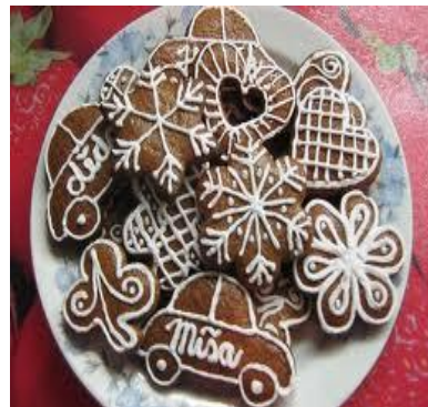
Miša Sobotková, 5. A