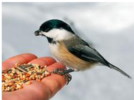
Denisa Boženíková, 5. A

A ještě nezapomeňte krmítko pověsit 1,5m nad zemí a 2m od stromu, aby na něj neskočila kočka.